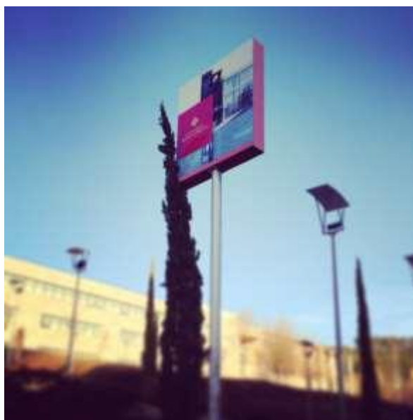
Fig. 1. Campus de Cuenca . José A. Perona. 2015

Todas las figuras y tablas se colocarán en un lugar próximo al que se citen por primera vez. Se colocará un pie Fig. seguido del número debajo de cada imagen o fotografía y un pie. Todas las fotografías deben tener una resolución de 300 puntos por pulgada.